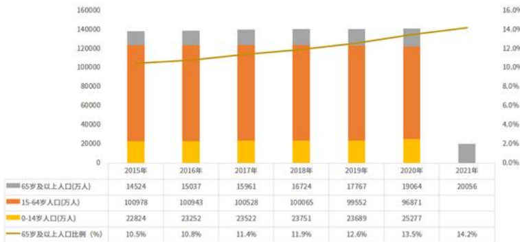
2015-2021年中国人口结构情况 China's population structure from 2015 to 2021