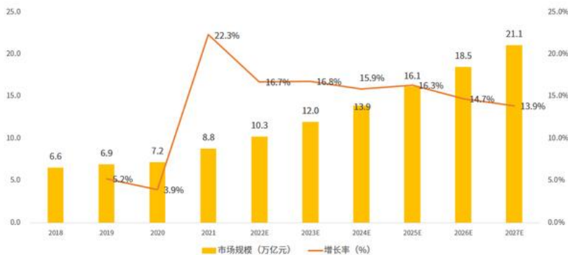
2018-2027年中国养老产业市场规模及预测 Market size and forecast of China's elderly care industry from 2018 to 2027